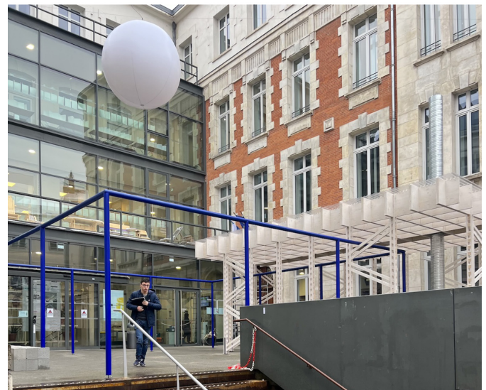
Pavillon échelle 1:1 - Atelier master 1 - cour de l'ENSASE