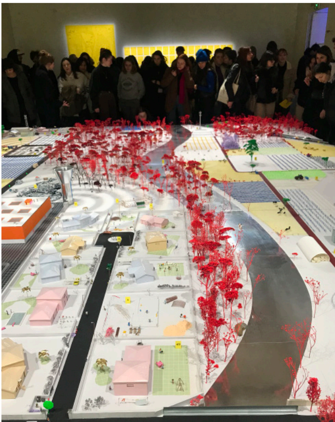
Exposition La Plaine - Etudiant·es de mater 2