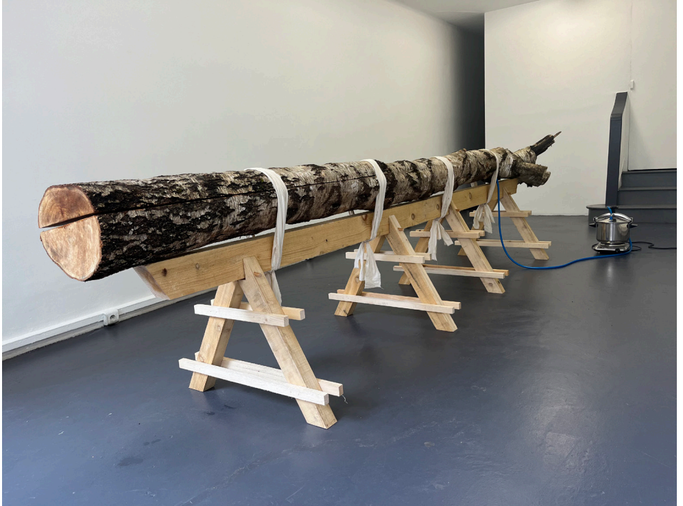
Boris RAUX. Sinus . Tronc de bouleau, cocotte minute et distillation continue - 2024