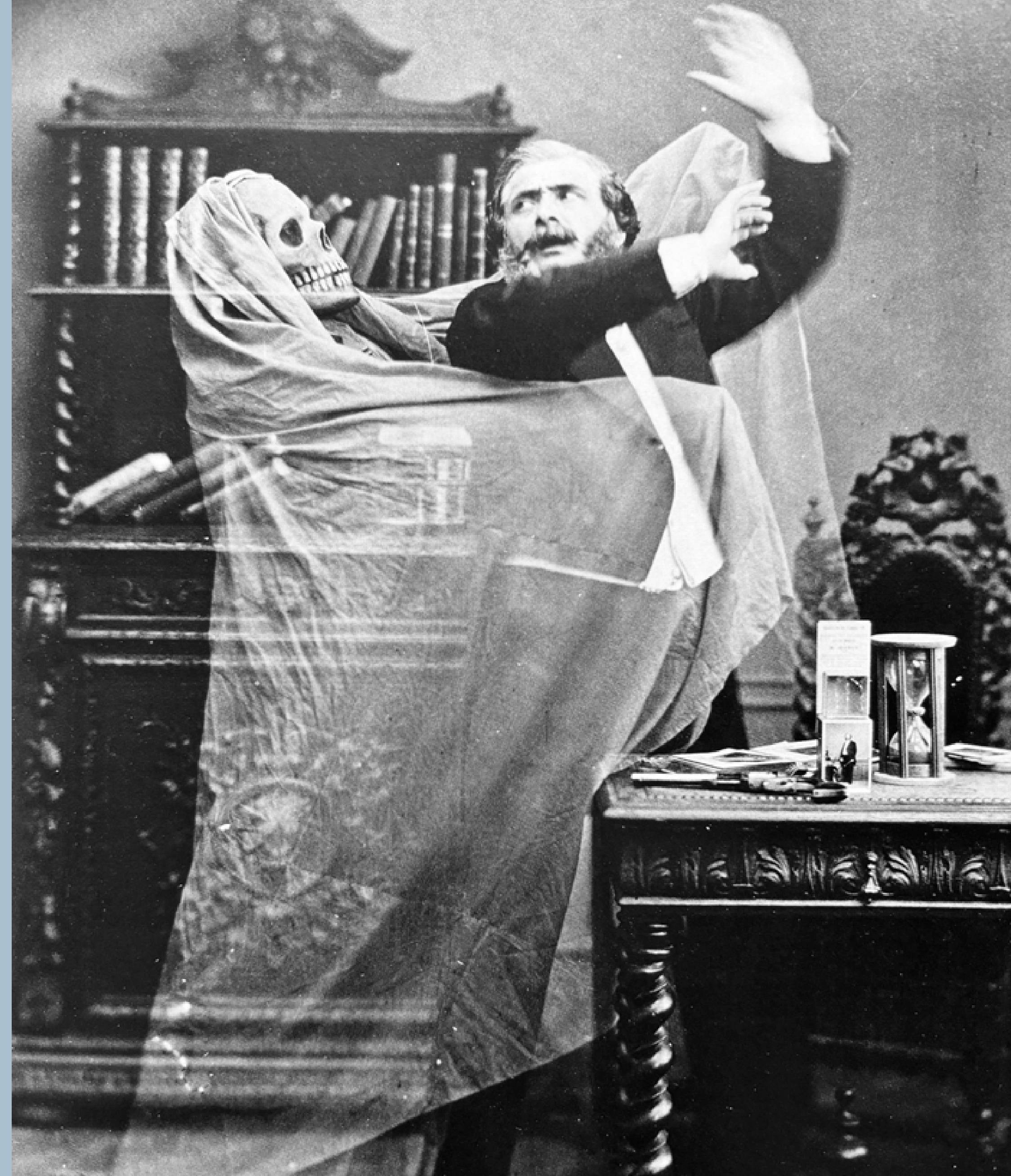
Allan Kardec, Photographie des esprits , Revue Spirit n°3, mars 1863