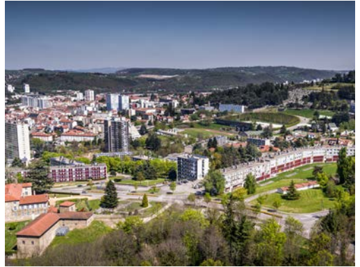
Vue de Firminy-Vert aujourd'hui (1961, architectes C. Delfante, J. Kling, M. Roux et A. Sive) et de la Maison de la Culture (1965, architecte Le Corbusier)